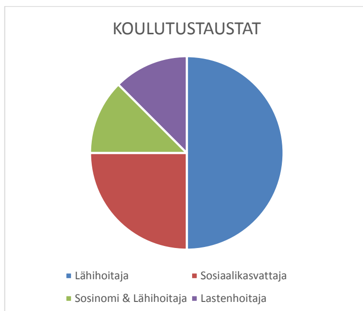
Kaavio 3. Työntekijöiden koulutustaustat

Kysyimme tutkimuksessa mukana olleiden henkilöiden työkokemuksesta ja vastauksia tuli tasapuolisesti jokaisesta työkokemusryhmästä. Myös koulutustaustat jakautuivat tasapuolisesti. Neljä vastaajista oli koulutukseltaan lähihoitajia, yksi lastenhoitaja, kaksi sosiaalikasvattajia, yhdellä oli sekä lähihoitajan että sosionomin tutkinnot. Saimme vastauksia monipuolisesti eri koulutustaustan omaavilta työntekijöiltä.