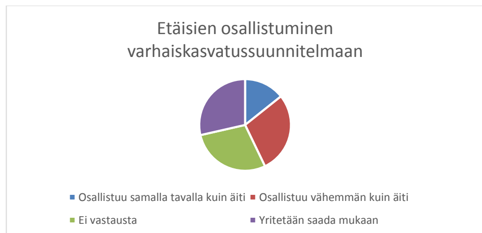
Kaavio 6. Etä-isän osallistuminen vasukeskusteluun

Jos ei ole paikalla keskustelussa, kysytään kun nähdään että pystyy samalla vaikuttamaan, annetaan mahdollisuus. H4