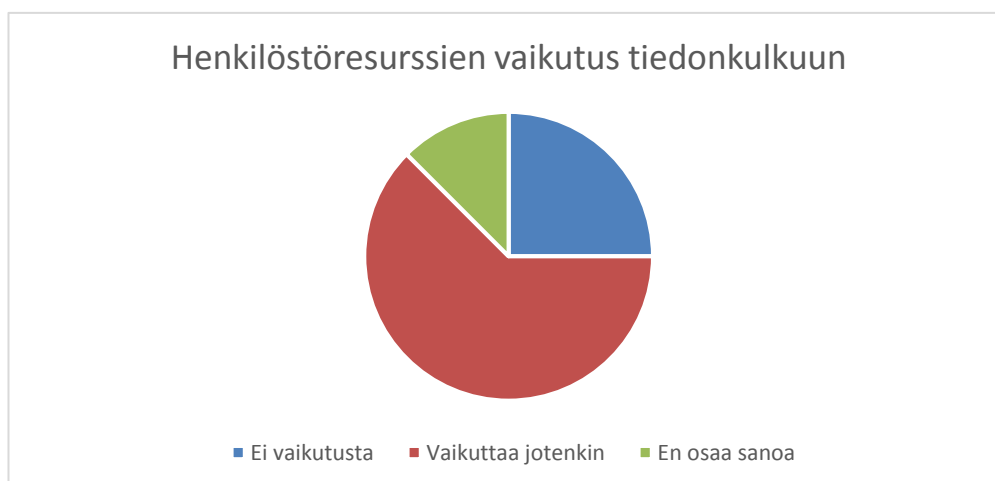
Kaavio 5. Henkilöstöresurssien vaikutus tiedonkulkuun

Mun mielestä eivät vaikuta. Jos haluaa kertoa ja näkee tärkeäksi onnistuu näilläkin resursseilla. H4