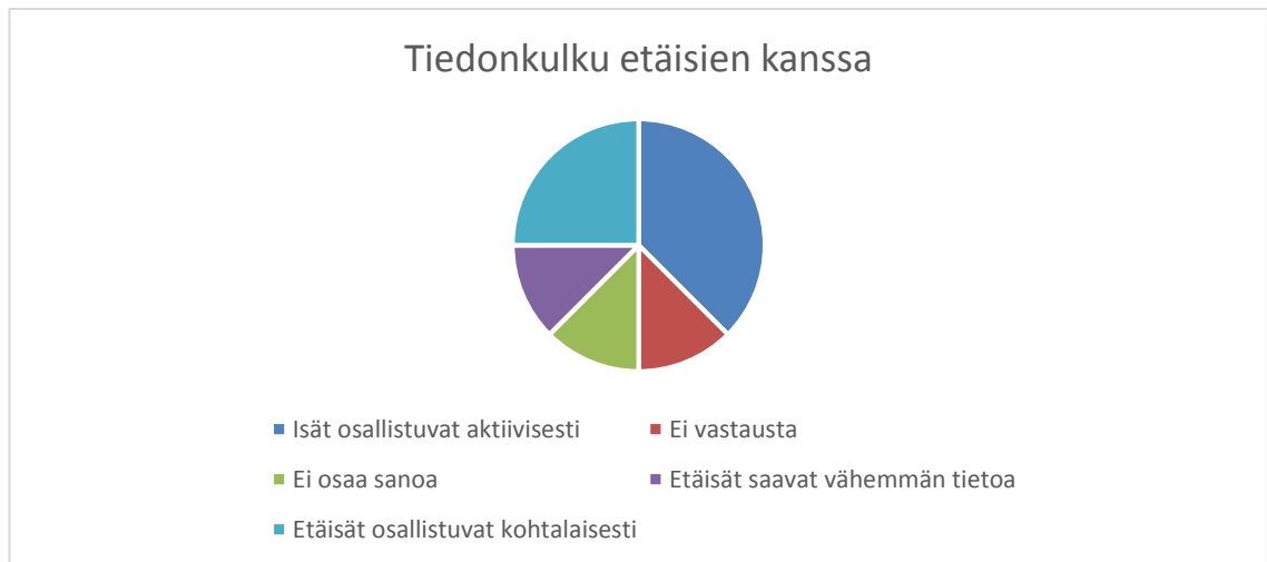
Kaavio 4. Kuinka koet vuorovaikutuksen ja tiedonkulun sujuvan etä-isien kanssa

Parantamisen varaa. Vanhempien kanssa pitää olla tosi tarkka ettei mene toisen puolelle. H2