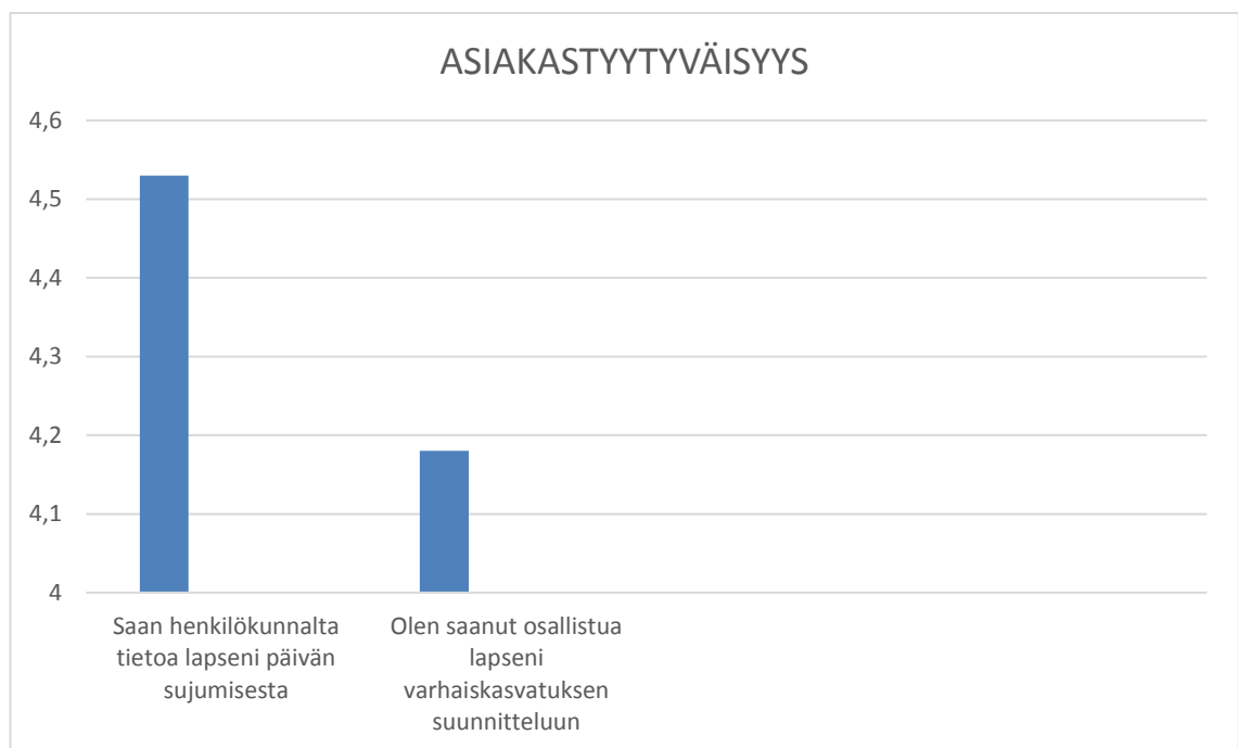
Kaavio 2. Asiakastyytyväisyys (Helsingin kaupunki 2016)

2. Olen saanut osallistua lapseni varhaiskasvatuksen ja esiopetuksen suunnitteluun ja toiminnan arviointiin? Arvosanaksi tuli 4,18, korkeimman arvosanan ollessa 5. (Helsingin kaupunki 2016.)